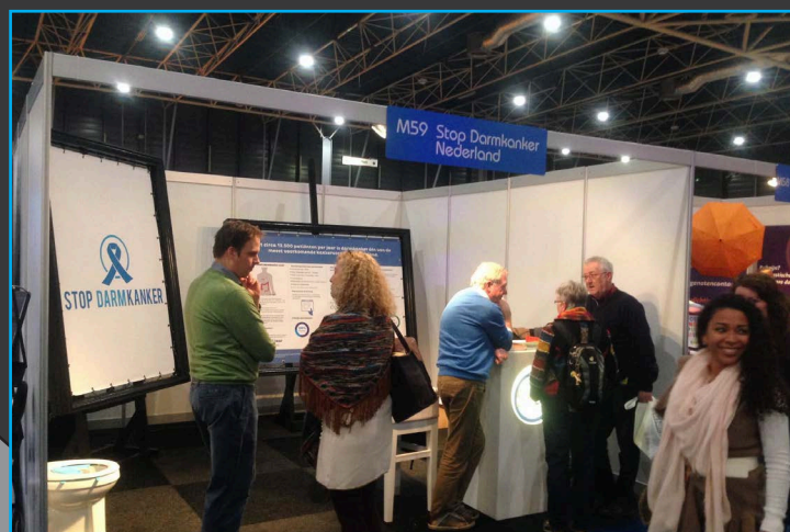
Deelname aan de Nationale Gezondheidsbeurs

Deze verplichting betreft een creditnota voor het uitvoeren van diverse werkzaamheden mbt het herstructureren van de website, welke in 2015 zijn uitgevoerd. Gezien het feit dat handels- en overige schulden een kortlopend karakter hebben, is de boekwaarde gelijk aan de reële waarde. De handels- en overige schulden zullen binnen de daarvoor geldende betalingstermijnen worden voldaan.