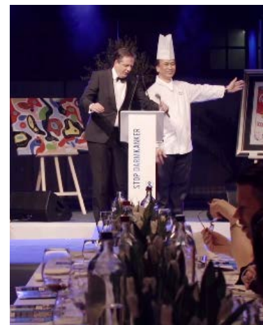
Veilingmeester Alexander Pechtold tijdens het Stop Darmkanker Gala

De nieuw opgezette website blijkt een groot succes te zijn. Maandelijks wordt de site ca 14.000 maal bezocht. Door de grote hoeveelheid aan informatie op de site was het noodzakelijk geworden om naar een uitgebreidere en grotere server over te gaan. Deze conversie is zeer arbeidsintensief geweest. Naast voorlichting staat op de website ook de verantwoording van de besteding van de ontvangen gelden, voortgang van het gesponsorde wetenschappelijk onderzoek en overige activiteiten. In 2015 is totaal voor 17.824 euro aan voorlichting besteed.