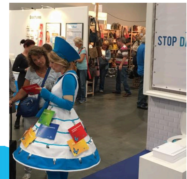
VOORLICHTING TIJDENS DE NATIONALE 50PLUS BEURS.