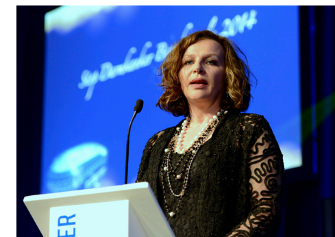
MINISTER SCHIPPERS (VWZ) TIJDENS DE STOP DARMKANKER FUNDRAISING NIGHT.

Uw steun wordt met de uiterste zorg besteed. Wij hopen dat wij u binnen onze club van 500 mogen verwelkomen en zijn u bij voorbaat dankbaar voor de steun!